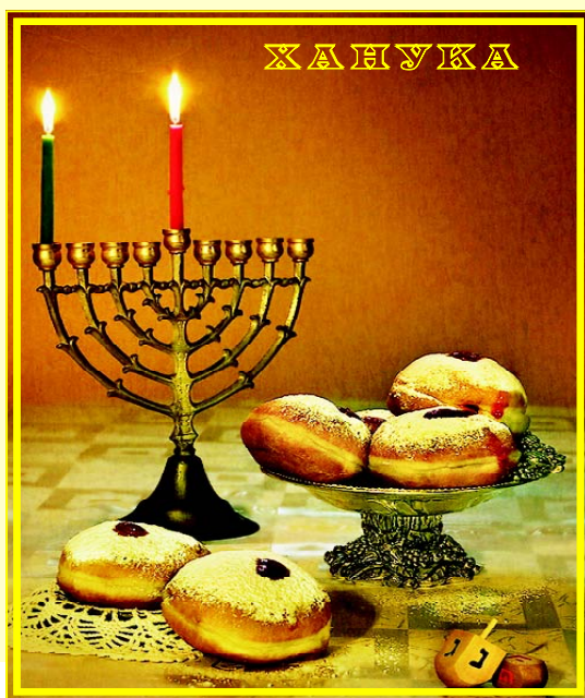
ХА НУ К А

Когда в Хануку зажигают специальные - ханукальные - свечи (в этом году с 21 по 28 декабря), обязательно произносят слова: «Благословен Ты, Всевышний... совершивший чудеса ради наших отцов в те годы, в это время». Такое необычное сочетание: в те годы - в это время. Наши мудрецы предвидели, что смысл этих чудес окажется актуальным не только в те годы, но и в «это» - наше - время.